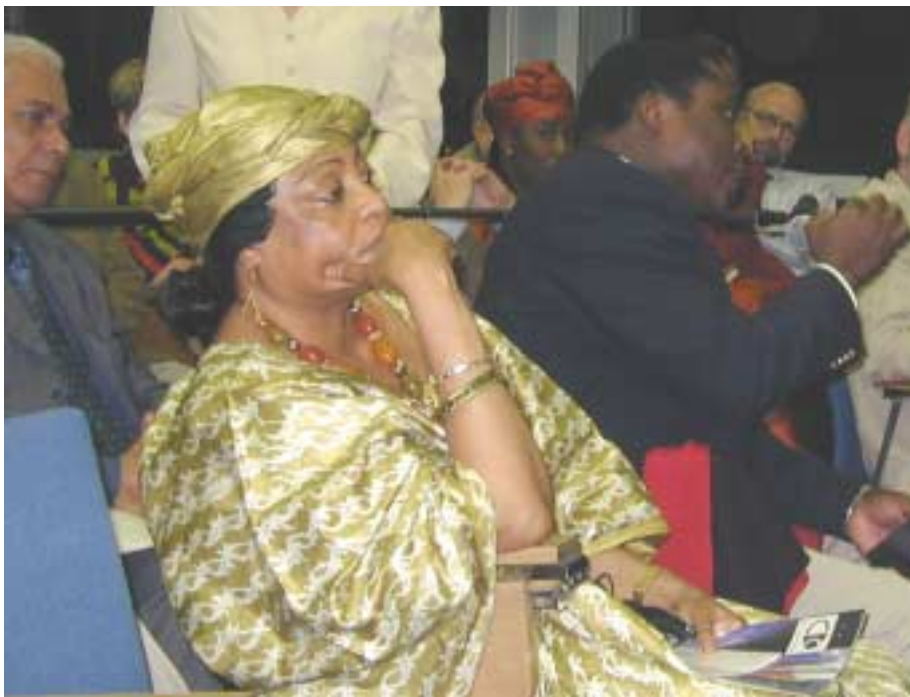
Left: Ambassador of Togo making a point.

She praised the excellent work that the present UN Secretary-General Kofi Annan - who hails from Ghana - had been doing since taking office on Jan 1, 1997. "We would like to express our gratitude to him for having agreed to continue in the job."