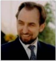
Zeid Ra'ad Zeid Al-Husseini

"The ... names that therefore came to the Council are the result of a more open process than has ever happened before, and the only way in which someone else could now emerge would be through the same process, through officially putting their name forward in a public manner to the Security Council...", he said in an interview.