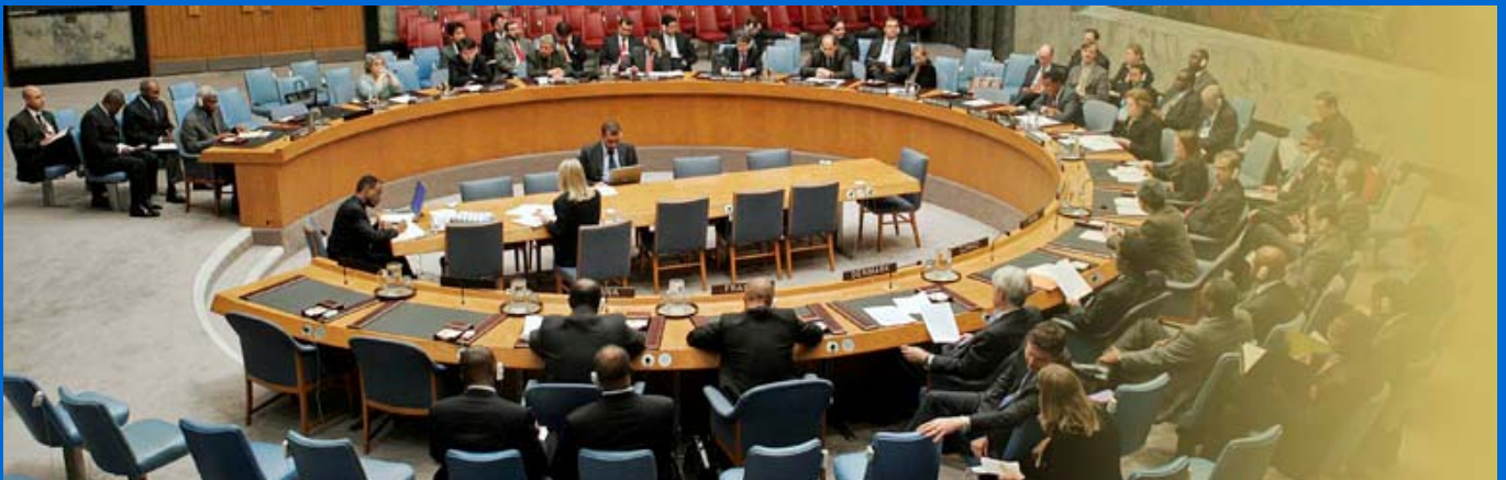
The UN Security Council.