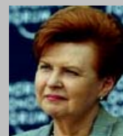
Latvian President Vaira Vike-Freiberga

Despite the secrecy shrouding the poll, Tharoor is of the view that the ongoing race for the SG's post has been "the most transparent race there has ever been" for the top UN job. >>>